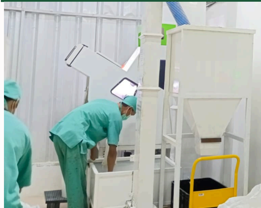
mesin color sorter

Mesin color sorter adalah salah satu teknologi yang digunakan dalam produksi beras untuk memisahkan beras berdasarkan warna dan menghilangkan beras yang tidak sesuai dengan standar QA.