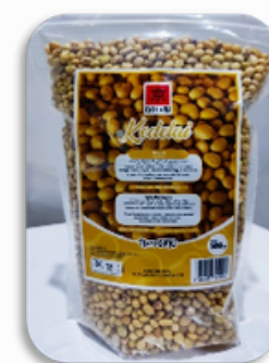
KYOHIKARI KEDELAI 500GR