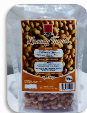
KYOHIKARI KACANG TANAH 450GR