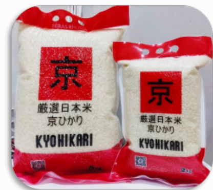
KYOHIKARI RICE 2KG DAN 5KG