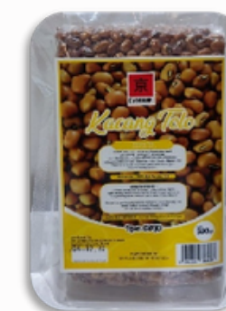
KYOHIKARI KACANG TOLO 500GR