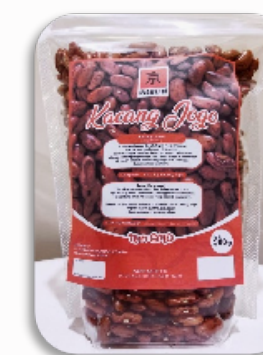
KYOHIKARI KACANG JOGO 500GR