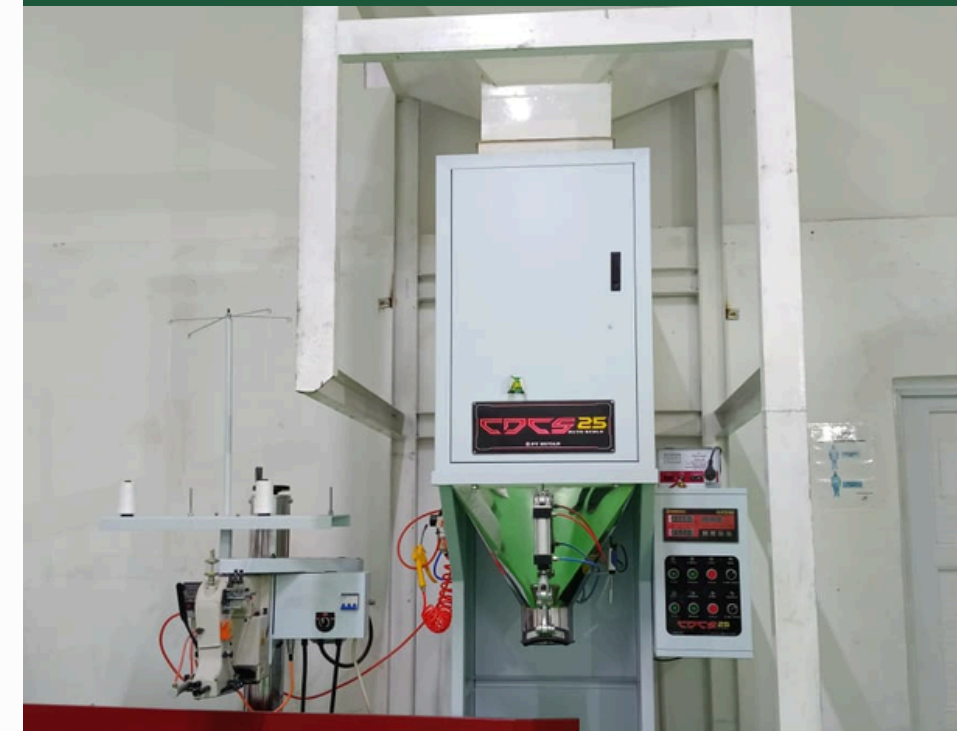
mesin timbang otomatis CDCS25

Mesin timbang otomatis adalah alat yang digunakan untuk mengukur berat suatu objek, dalam hal ini beras, dengan akurat dan otomatis.