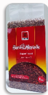
KYOHIKARI RED RICE 1KG