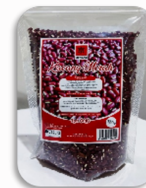
KYOHIKARI KACANG MERAH 500GR