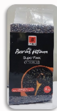
KYOHIKARI BLACK RICE 1KG