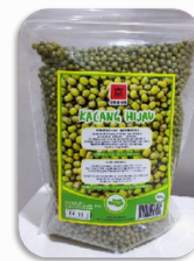
KYOHIKARI MUNG BEAN 500GR